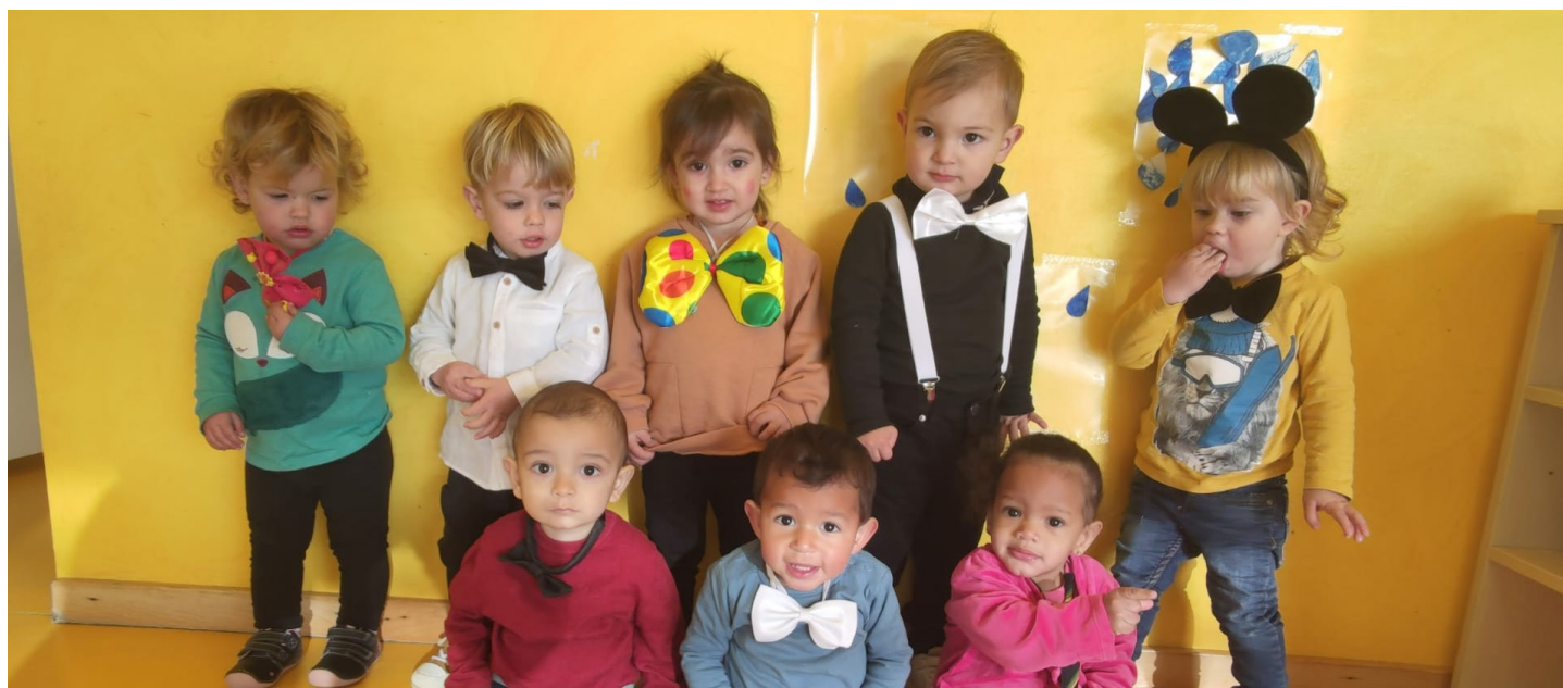
Xiquets i xiquetes de la Llar d'Infants Xerinola amb les seves disfresses.

La regidoria de Festes ha organitzat una programació completa per aquest cap de setmana, amb dues tardes i dues nits de celebració d'aquesta festivitats, on tot s'hi val.