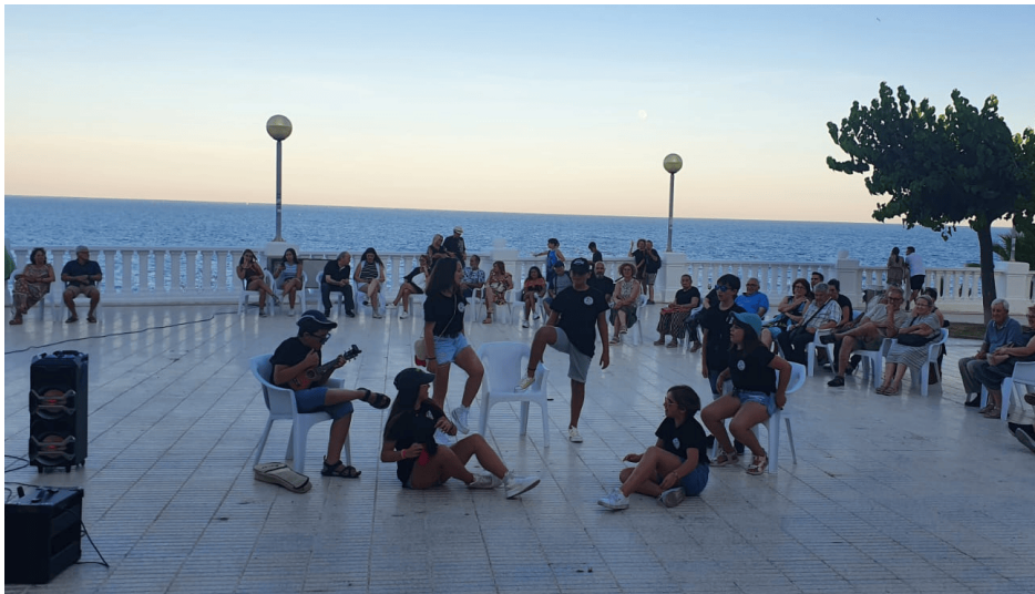
Alumnes de l'EMMA al 'Rock a la plaça'.

Prop d'una trentena d'activitats lúdiques, culturals i esportives tindran lloc al municipi al mes de juliol per tots els gustos.