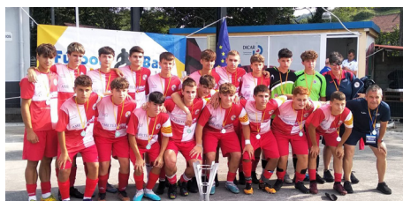
CD La Corredoria.

La dinàmica de l'equip calero va anar de pitjor a millor. Al primer partit, els va costar adaptar-se al camp de gespa natural i van perdre 3 a 0 contra el CD ArmePalmas. Al segon partit, van guanyar 6 a 0 al Lada Langreo d'Astúries i el tercer també va acabar amb la victòria dels caleros 2 a 0, davant del