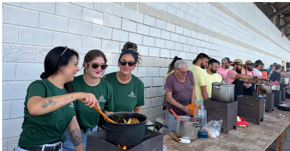
Llotja de la Confraria de Pescadors de l'Ametlla de Mar.

La Diada de l'Arrossejat va omplir dissabte passat als voltants de la llotja del peix de la Confraria de Pescadors, una 37a edició multitudinària d'aquesta festa de promoció de la gastronomia local.