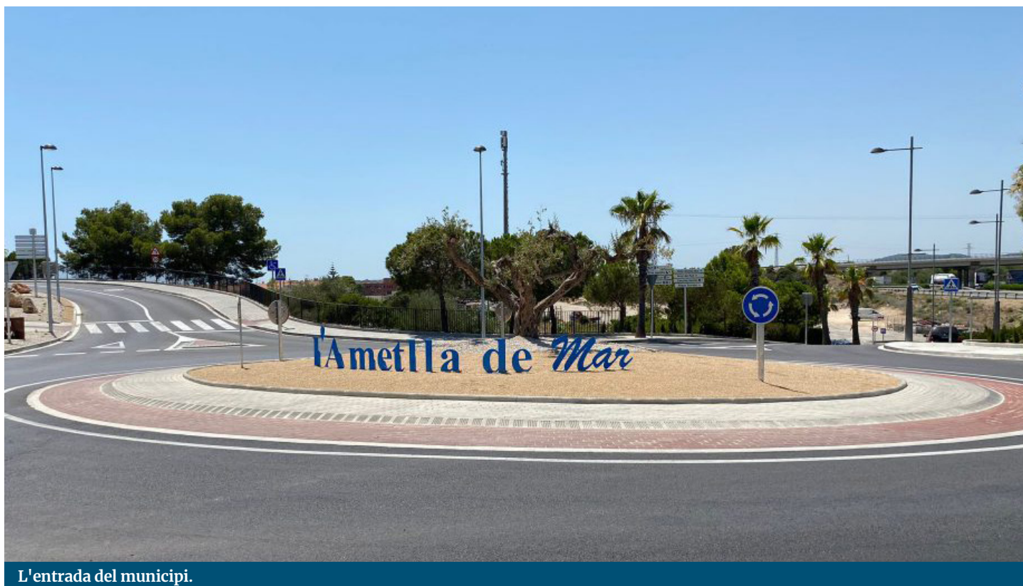
L'entrada del municipi.

Abans del 2027, la Diputació vol impulsar dues rotondes més a l'accés a l'Ametlla de Mar des de l'N-340.