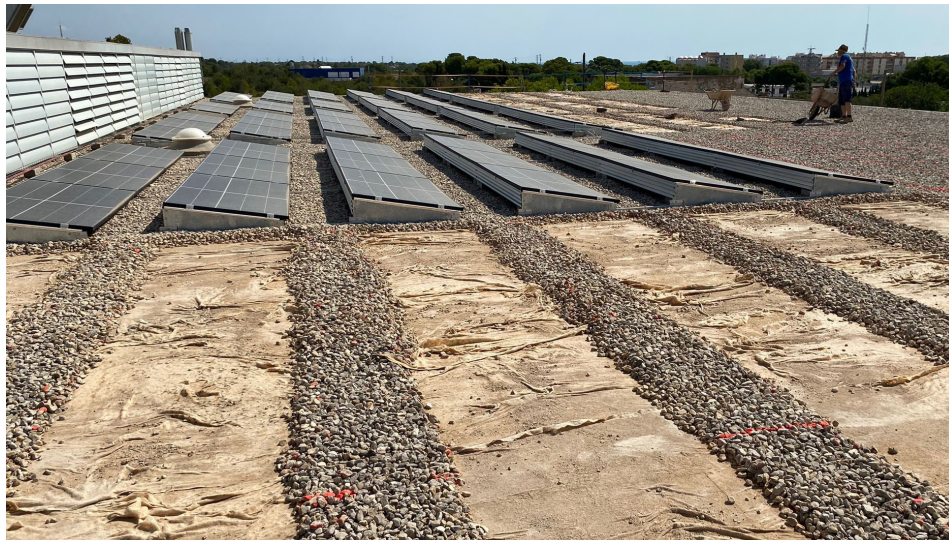
Plaques fotovoltaïques al cem La Cala.

S'instal·laran un total de 80 noves plaques fotovoltaïques de 450 W de potència que produiran 36 kW que contribuiran a reduir el consum i, per tant, la despesa econòmica.